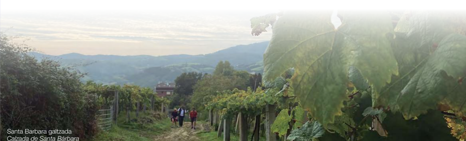
Santa Barbara galtzada Calzada de Santa Bárbara