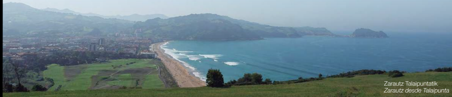
Zarautz Talaipuntatik Zarautz desde Talaipunta

km 0 ... ORIO. Oria ibaiaren itsasadarra zeharkatu ondoren, hantxe hartzen dute atsedean herriko arrantza-ontziek, tren-geltokiaren ondotik igaroko gara, San Paulo basiliza txikiaren bila. Handik abiatzen da bideka atsegin bat, Orioko itsasadarraren eta hiribiduaren bista ederrak eskaintzen dituena, Oribarzar hondartzak txikiaren ondora iritsi arte. Txakolin-mahastiz betetako mendi-mazelak izango ditugu lagun Talaimendiko gaineraino.