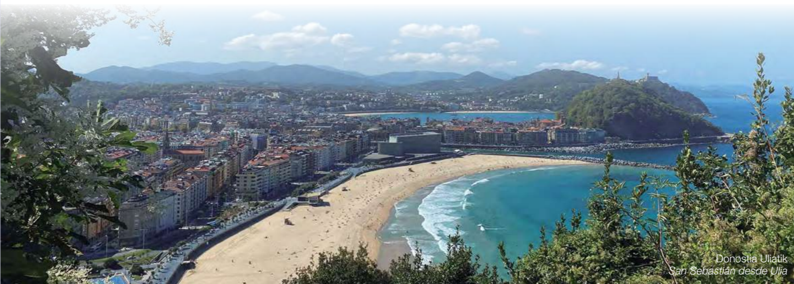
Donostia Uliatik San Sebastián desde Ullia