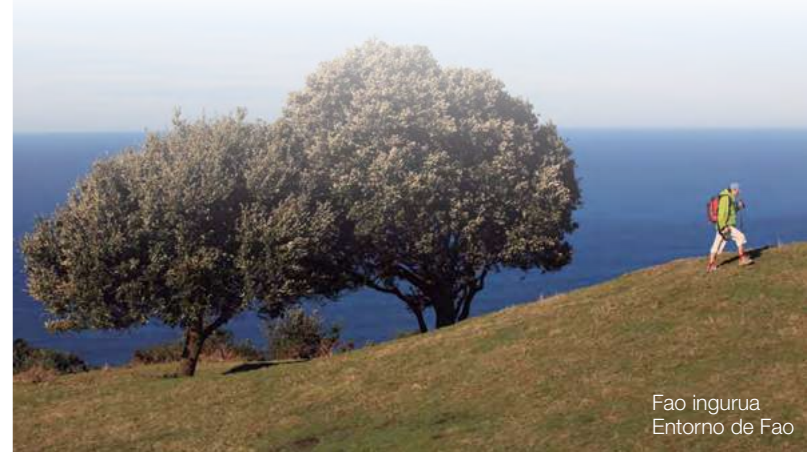
Fao inguru Entorno de Fao