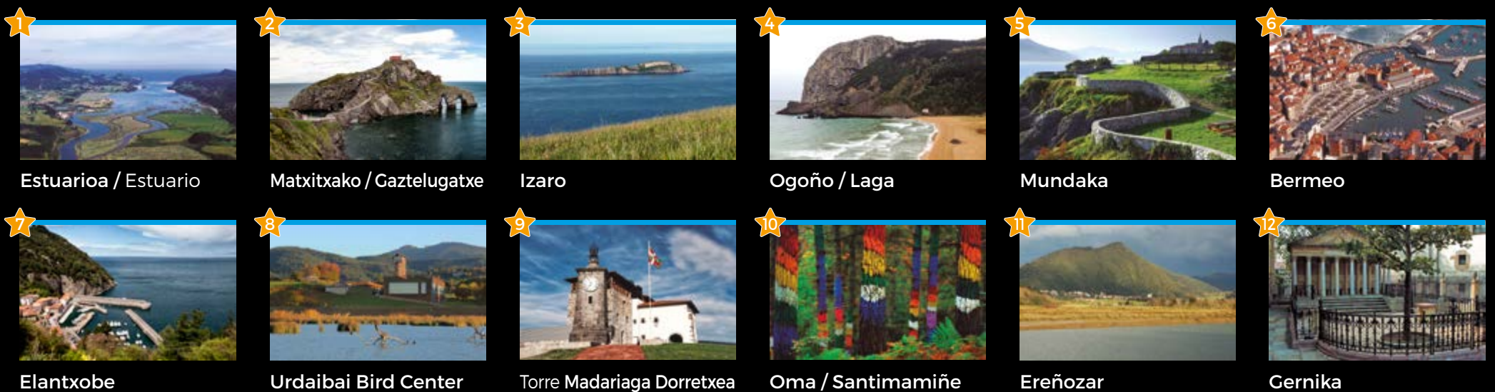
Estuariora / Estuario