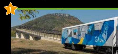
Vasco Navarro Zeritzonaren Bide Berdea Vía Verde del FC Vasco Navarro